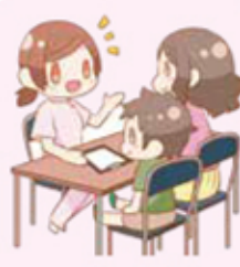
保健所 保健センター