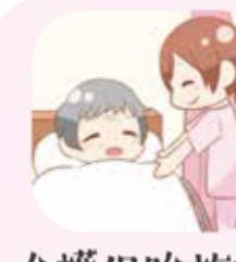
介護保険施設 社会福祉施設