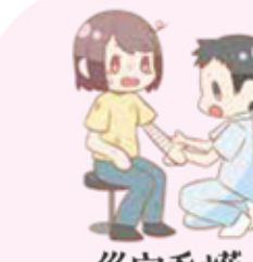
災害看護 国際ボランティア