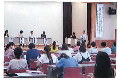
長野県、長野県助産師会との共催研修 7月6日