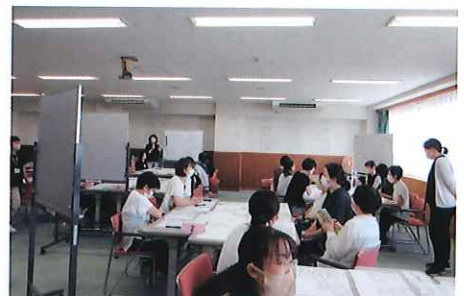
助産師支援研修「災害時対応」9月12日